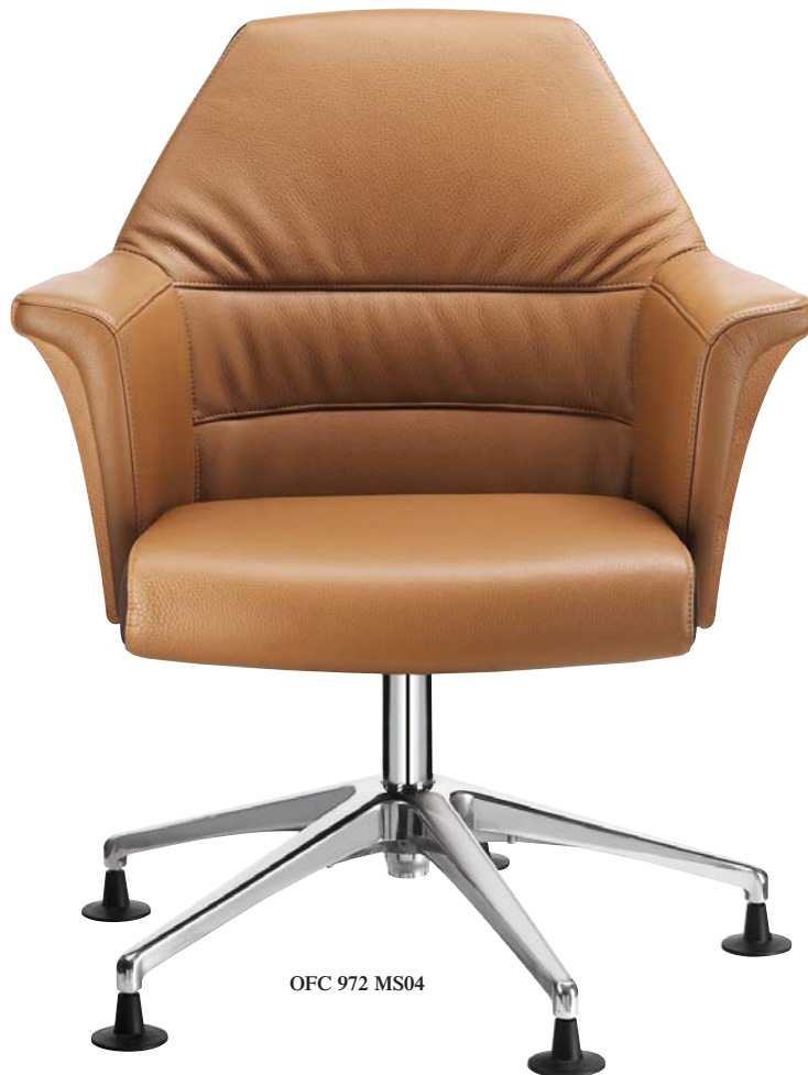
OFC 972 MS04