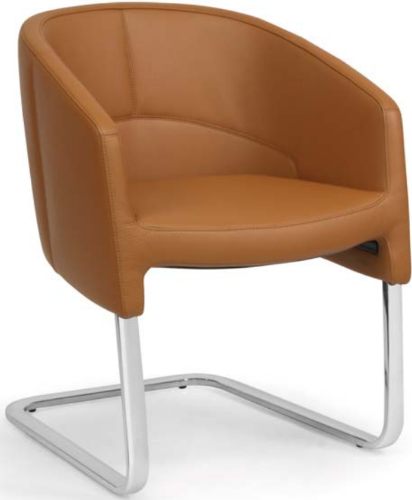
OFC 972 L MS04